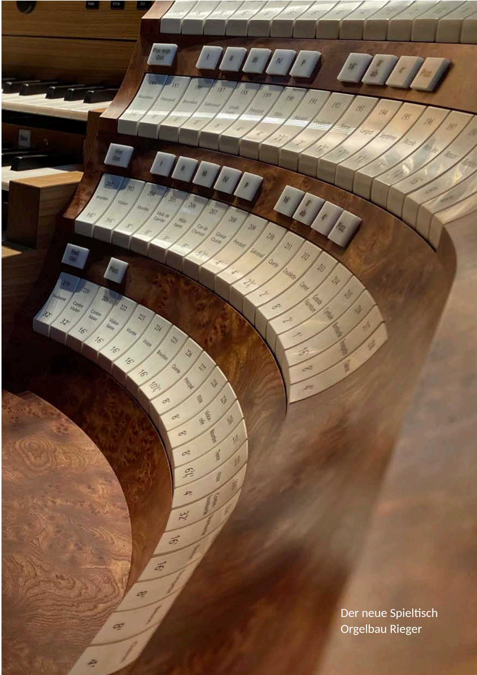
Der neue Spieltisch Orgelbau Rieger